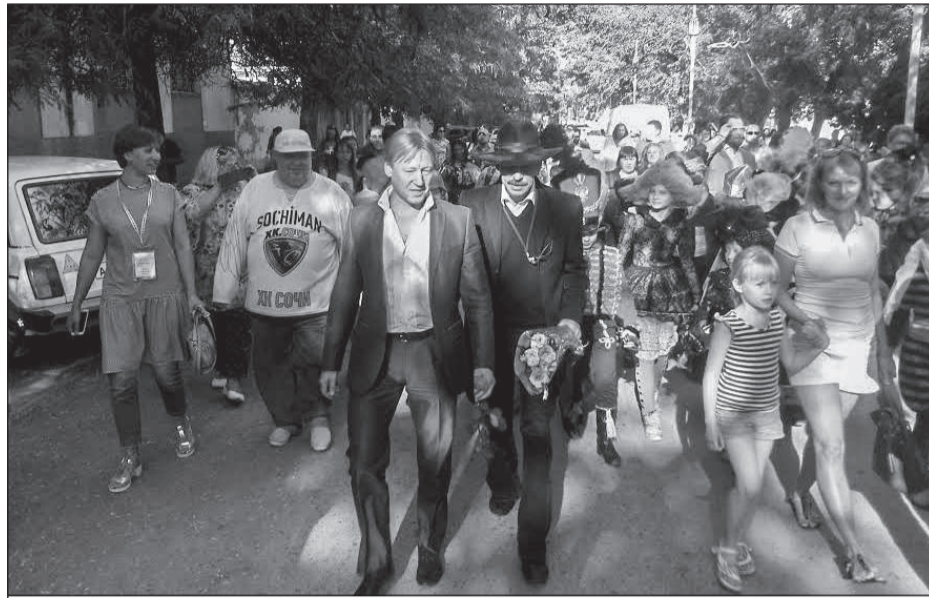
Артисты прогулялись по улице Бартенева

— Мы объявляем конкурс на лучший символ фестиваля, приз фести-