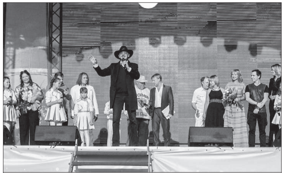
Михаил Боярский исполнил прославленную песню мушкетеров из легендарного фильма «Д'Артаньян и три мушкетера»

— В моем детстве был пионерский лагерь «Метеор» с 3-го по 10-й класс. И все, что со мной происходило в дальнейшей жизни, — все это я обязан этому лагерю, этому счастливому, радостному островку моего детства, его тоже можно назвать солнечным. Все главное, что происходит с человеком, когда он вырастает, берет начало в детстве. Поэтому очень важно, особенно сейчас, когда мы живем в очень сложные для культуры времена. Если углубляться в эту тему, у нас очень серьезная конкуренция с Западом — безусловно, вы знаете, что кино у нас вытесняет западная продукция. В рамках фестива-