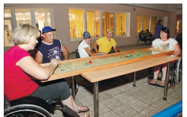
ВСТРЕЧА ЧЕМПИОНОВ Наш город принимает Всероссийский фестиваль «Пара-Крым-2016»