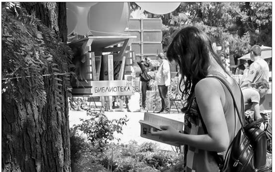
Заслуженную популярность у евпаторийцев и гостей города завоевал проект ЕЦБС «Мобильная библиотека»

В честь юбилея в читальном зале библиотеки состоится официальная церемония награждения работников библиотеки и поздравления коллектива со столетием учреждения, вручение грамот и благодарностей творческим партнерам ЦГБ. Театрализованная миниатюра и слайд-презентация «Колесо библиотечной истории» познакомят гостей вечера с историей создания библиотеки. Также состоится выступление творческих коллективов города. В интернет-центре откроется выставка технических средств «Ретро-взгляд из XXI века», знакомящая с техническими средствами, которые использовались в библиотеке на протяжении многих лет. На площадке перед библиотекой горожане и гости праздника смогут «прогуляться» по «поздравительной аллее» и оставить свои пожелания библиотеке на специальном панно. Здесь откроются книжные экспозиции «Великолепный век библиотеки двух Александров» и «Евпаторийская библиотека: 100 лет на ниве просвещения книжного». Для ознакомления будут выставлены фотоальбомы и хроника газетных публикаций «Зеркало времени — библиотека», оформлен библиографический вернисаж «Библиотечная типография» в действии», рассказывающий об издательской работе учреждения. Все желающие смогут принять участие в мастер-классе по изготовлению поздравительных открыток к столетию библиотеки имени А.С. Пушкина, в эрудит-викторине «Пушкин и музыка». Для детей будет подготовлена культурно-информационная программа «У Лукоморья дуб зеленый...». Кроме того, в этот день для гостей будет работать трактир «У Библиотеки».