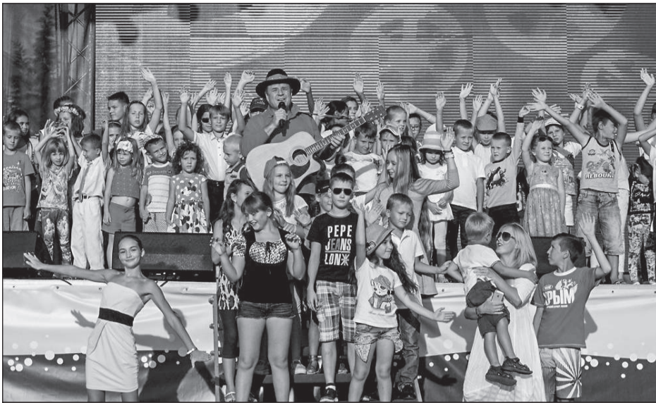
Григорий Гладков выступил в окружении юных евпаторийцев

за это, потому что они (под- ростки. — Ред. ) — ведомые в некотором смысле, они открыты к восприятию, они выбирают для себя. А выбор, к сожалению, они предлагают. А предлагают то, что приносит прибыль, — посетовал Харатьян.