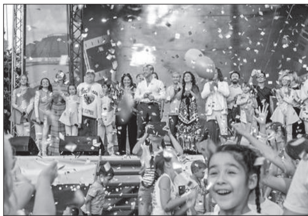
Гости церемонии радовались будущему фестивалю не меньше детей

валя, вернее сказать. Мы будем рады откликнуться на присылаемые заявки, — заявил он. — Мы откроем сайт и будем там публиковать результаты конкурса. Мы вообще хотим, чтобы это (фестиваль-