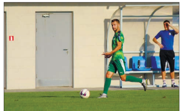
НИКТО НЕ ХОТЕЛ УСТУПАТЬ Футбольные клубы «Евпатория» и «Кафа» сыграли вничью