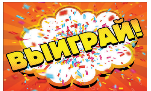
ВЫИГРАЙ БИЛЕТ В КИНОТЕАТР! Розыгрыш призов от «Евпаторийской здравницы» продолжается