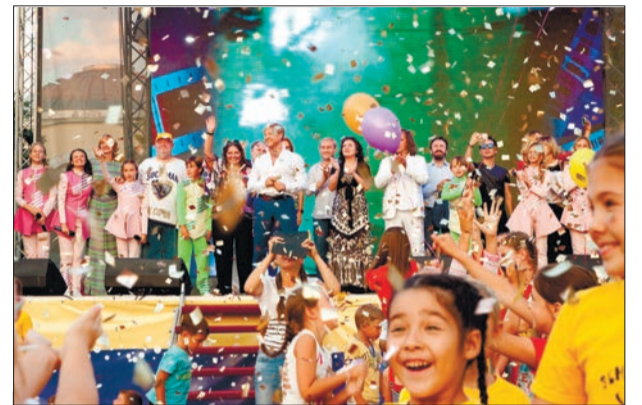
ЗВЕЗДНАЯ ЕВПАТОРИЯ Фестиваль детского кино «Солнечный остров» собрал российских звезд