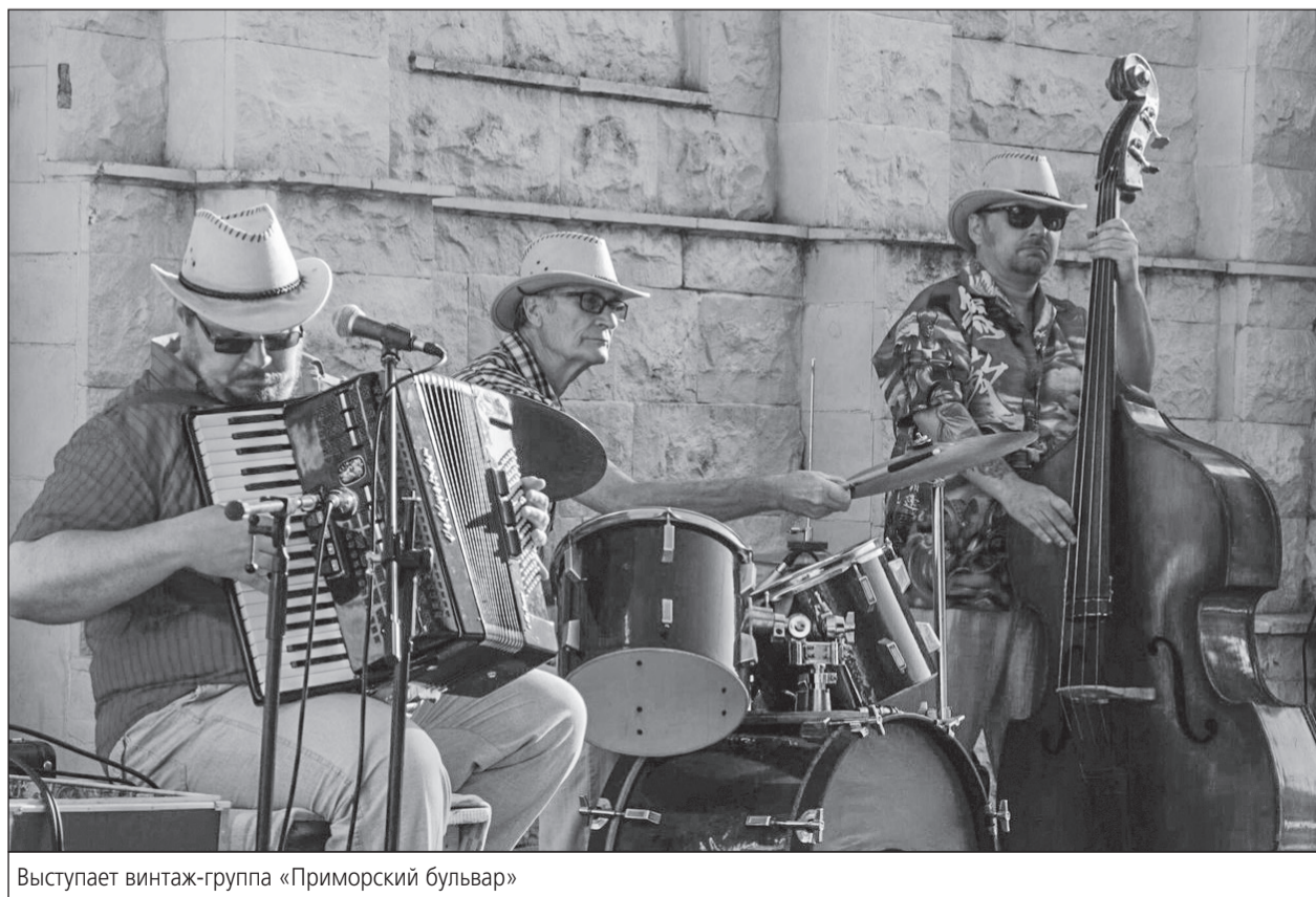
Выступает винтаж-группа «Приморский бульвар»