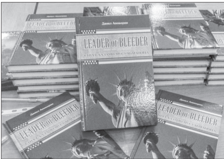
Книга Данила Апокорина «США глазами мусульманина»