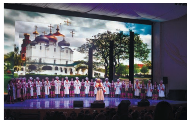
ФОРУМ НА ВЫСШЕМ УРОВНЕ Делегация из Евпатории приняла участие в церемонии открытия фестиваля «Великое русское слово»