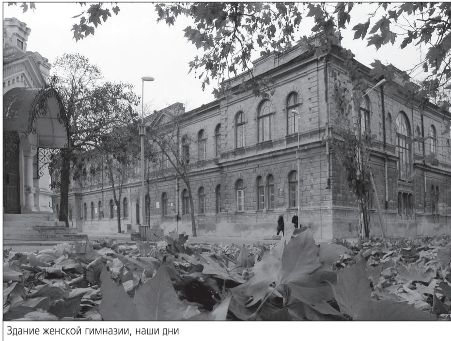
Здание женской гимназии, наши дни

Конечно, даже этот приведенный перечень несет яркие знаки времени и существенно отличается от картины в дореволюционной Евпатории. Согласно «Спутнику по городу