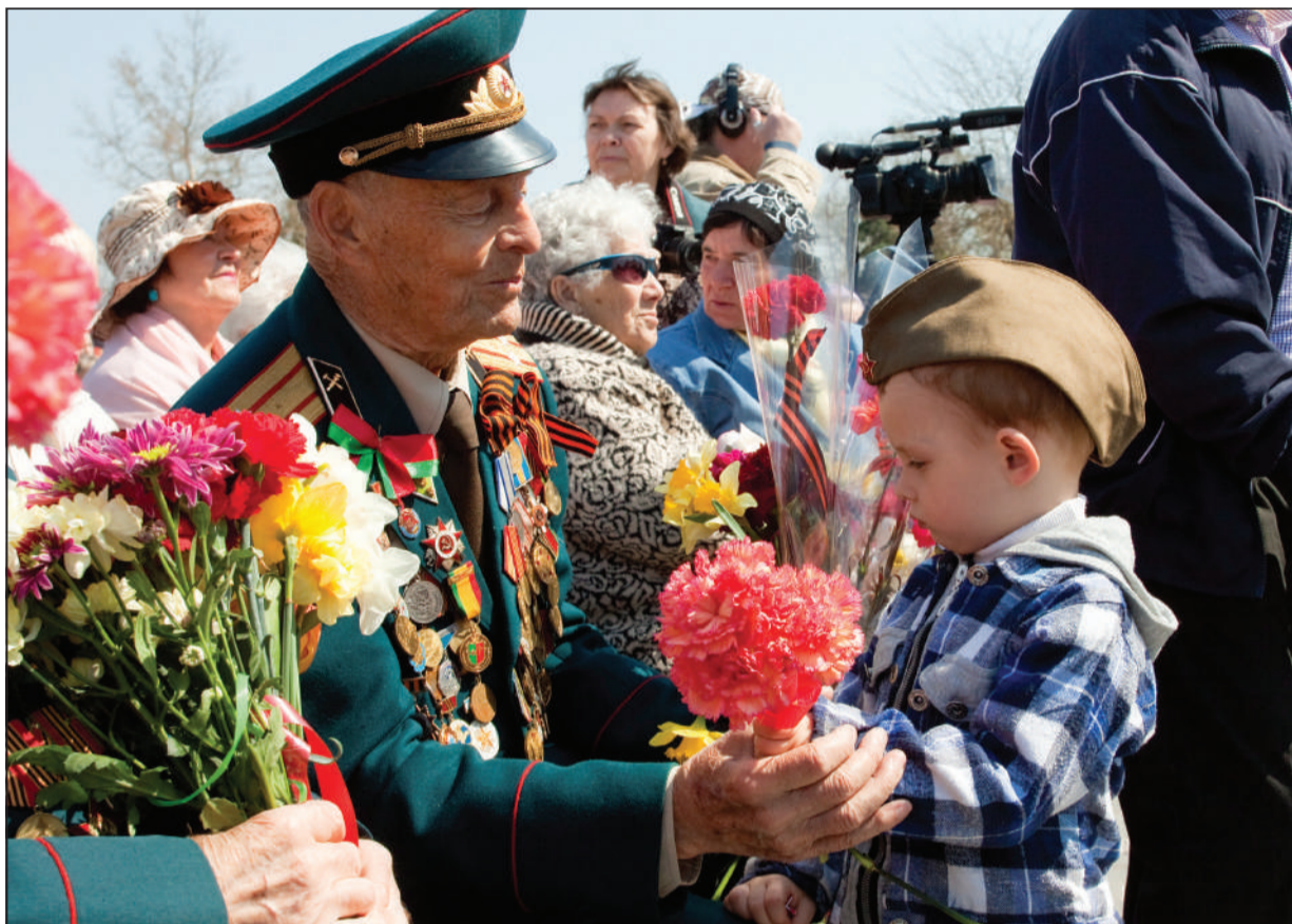
Евпаторийские ветераны с особым трепетом принимают поздравления от самых маленьких горожан