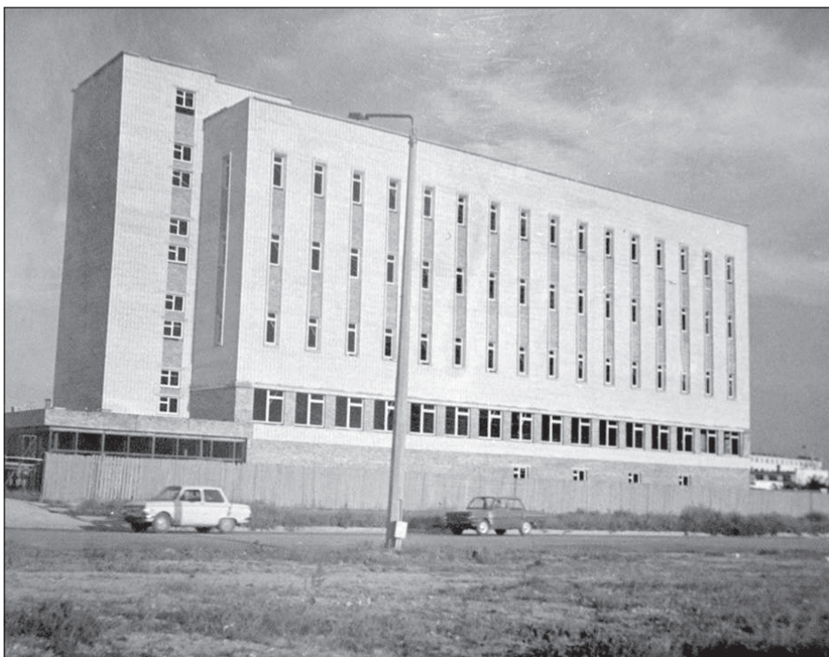
То самое здание на проспекте Победы, где в 1986-м установили первую очередь новой АТС-5