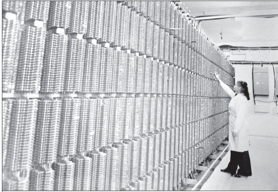
Первыми к новой станции, введенной в строй в канун Дня Победы, подключили телефоны ветеранов Великой Отечественной

Работы выдались настолько сложными, что, пожалуй, правильно будет назвать всех, кто в далеком 1986-м помог городу налаживать телефонную