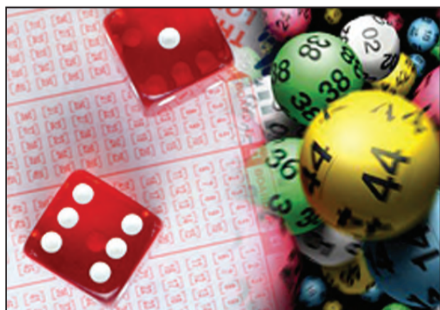
ЧИТАЙТЕ, СМОТРИТЕ, ВЫИГРЫВАЙТЕ! Совместный проект «ЕЗ» и ТРК «Евпатория» разнообразит досуг и заставит поработать головой