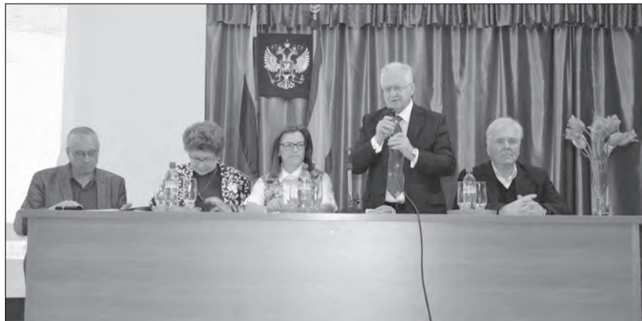
В Евпатории прошел XVI Конгресс курортологов и физиотерапевтов Республики Крым.

В его работе участвовали ученые, занимающиеся вопросами санаторно-курортного и восстановительного лечения и реабилитации больных с различными патологиями. В течение двух дней работы конгресса состоялось четыре пленарных заседания, на которых