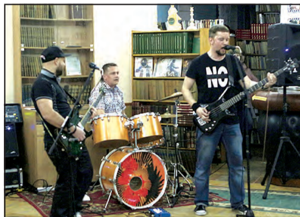
МИСТИКА, КНИГИ, РОК-Н-РОЛЛ Первая в городе «Библионочь» показала: библиотека – это не только место для чтения...