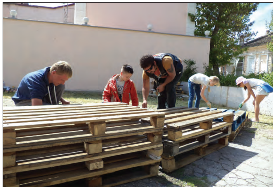
Вместе со взрослыми юные воспитанники «Лаборатории архитектурной мысли» орудовали кистями и щетками, как опытные маляры