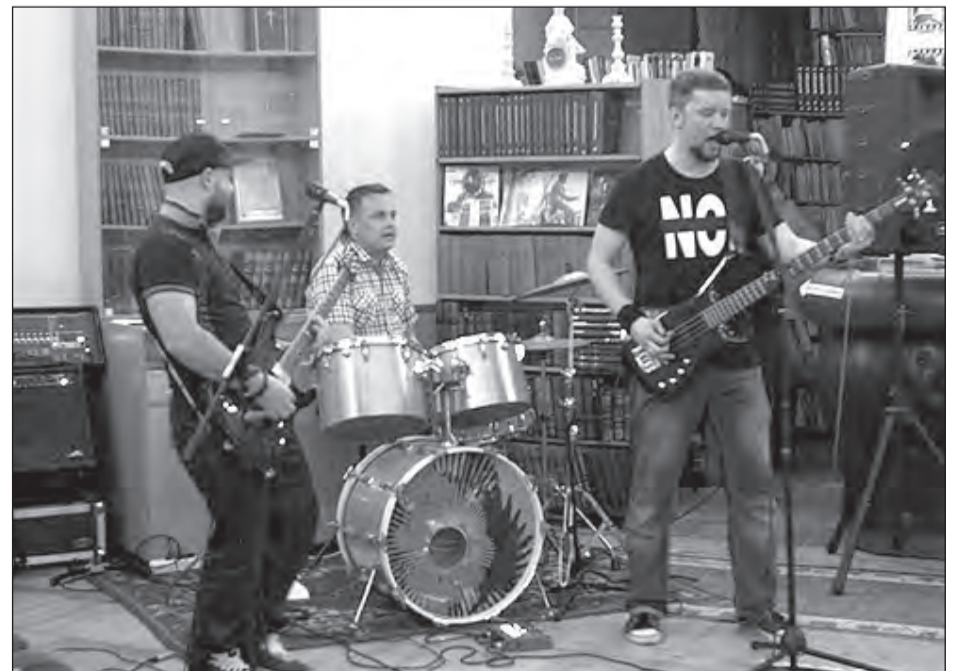
Вечер завершился концертом группы «Семь»

Интерактивная программа «Ночь киномана» предлагала гостям участвовать в блиц-опросах и конкурсах на звание лучшего знатока отечественного киноискусства. В начале организаторы «Библионочи» провели для участников праздника краткий экскурс в историю «кинематографа», продемонстрировав отрывки из классических немых