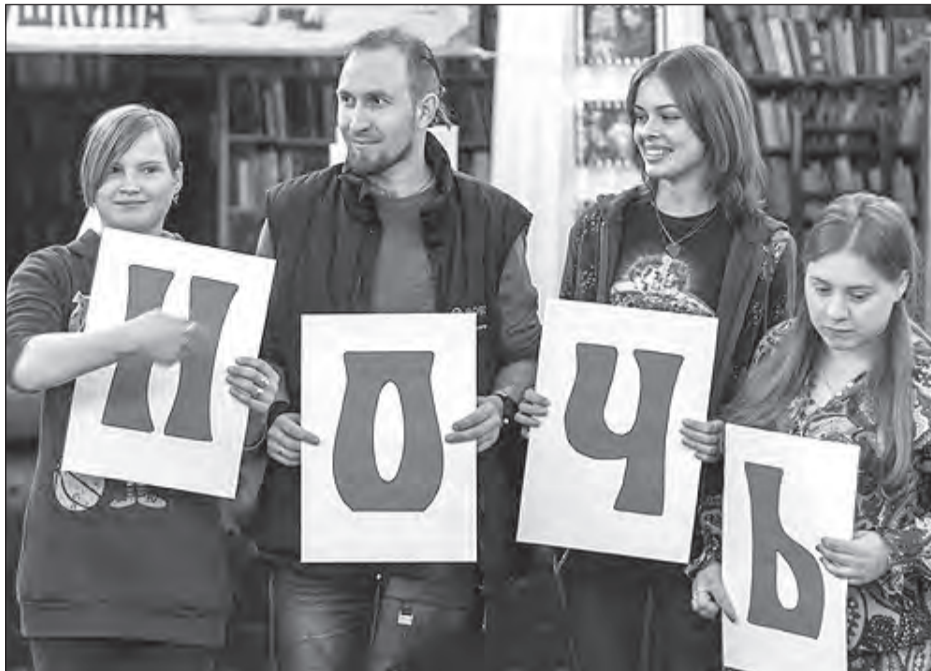
Участники одного из многочисленных конкурсов

В «Библионочь» библиотекари организовали квест по недоступному обычно посторонним книгохранилищу: переодетые в костюмы фей, освещая путь фо-