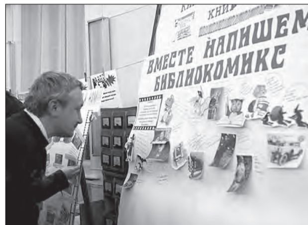
Посетителям «Библионочи» предлагали самим нарисовать «библиокомикс»

В этот вечер сотрудники библиотеки открыли для посетителей фонды читального зала библиотеки. В темных проходах между некоторыми шкафами любопытные участники