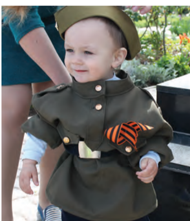
жения Евпатории при поддержке Евпаторийского городского совета и администрации города.