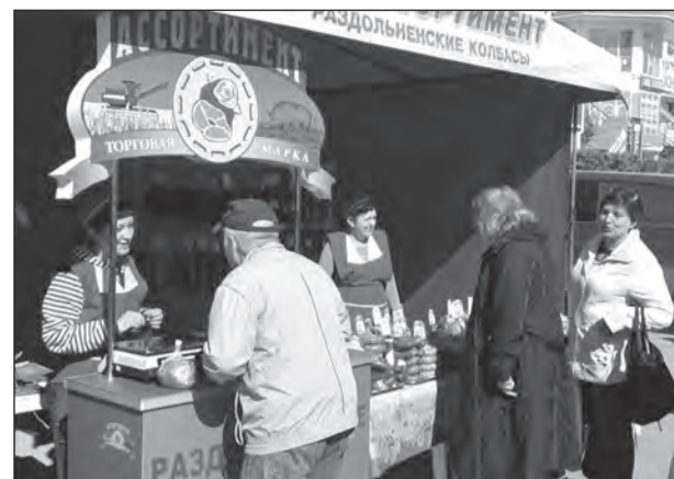
В многоотраслевой весенней ярмарке приняли участие более двухсот товаропроизводителей из разных районов и городов Крыма