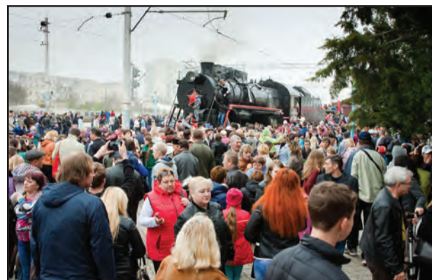
ВСТРЕТИЛИ ПОЕЗД ПОБЕДЫ День освобождения города отметили грандиозно и торжественно