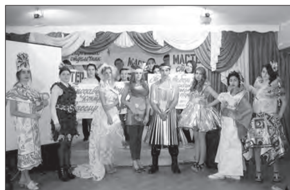
Учащиеся техникума демонстрируют наряды, созданные из подручных средств