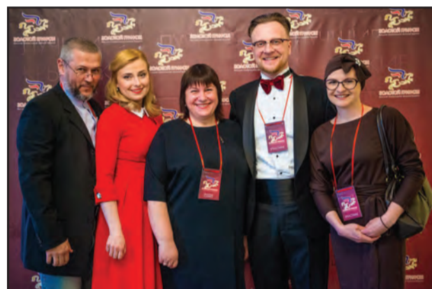
КРЫМСКИЙ «ОСКАР» Наши земляки победили в пяти номинациях республиканской театральной премии