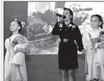
Юные наследники Великой Победы