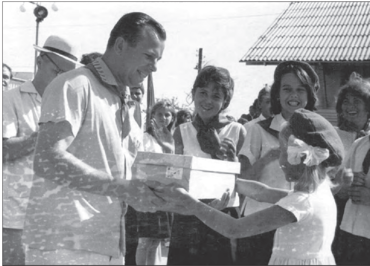
Встреча Юрия Гагарина с пионерами лагеря его имени в Евпатории 22 августа 1965 года