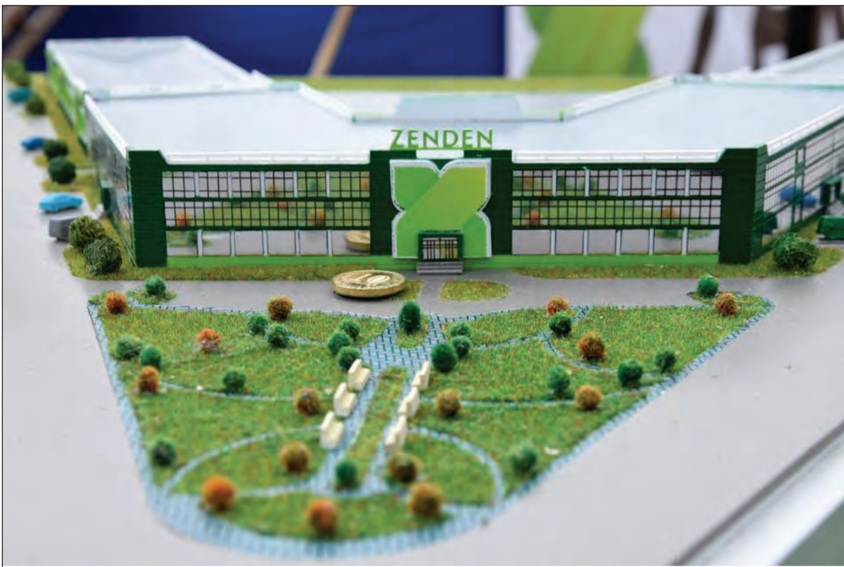
Так будет выглядеть будущая фабрика