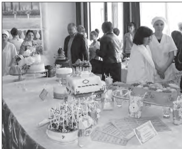
О мастерстве будущих поваров-кондитеров красноречивее всего говорят приготовленные ими торты

Совсем скоро для выпускников городских школ прозвонит последний звонок. А значит, будущим абитуриентам уже сейчас пора решить для себя, какую профессию выбрать и какое учебное заведение им по душе. Сами же университеты, институты, училища и техникумы по всей стране проводят дни открытых дверей, призванные помочь выпускникам в этом непростом выборе. Состоялся такой день и в Евпаторийском техникуме строительных технологий и сферы обслуживания.