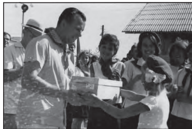
«К НАМ ЕДЕТ ГАГАРИН!» О том, как Евпатория встречала первого космонавта