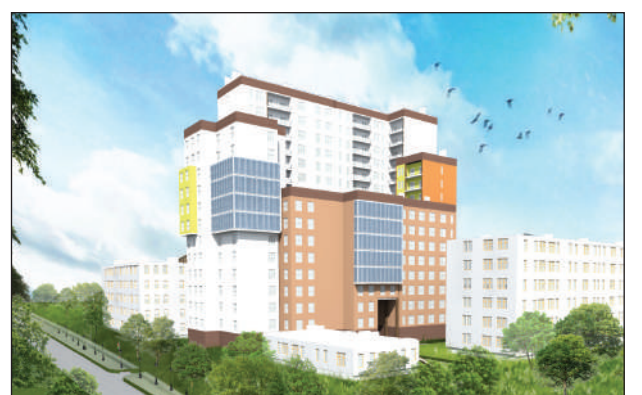
«Крымская ривьера» возводит в Евпатории ультрасовременный жилой комплекс