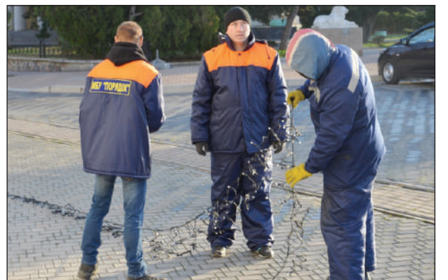
В Евпатории подготовка к новогодним праздникам вышла на финишную прямую