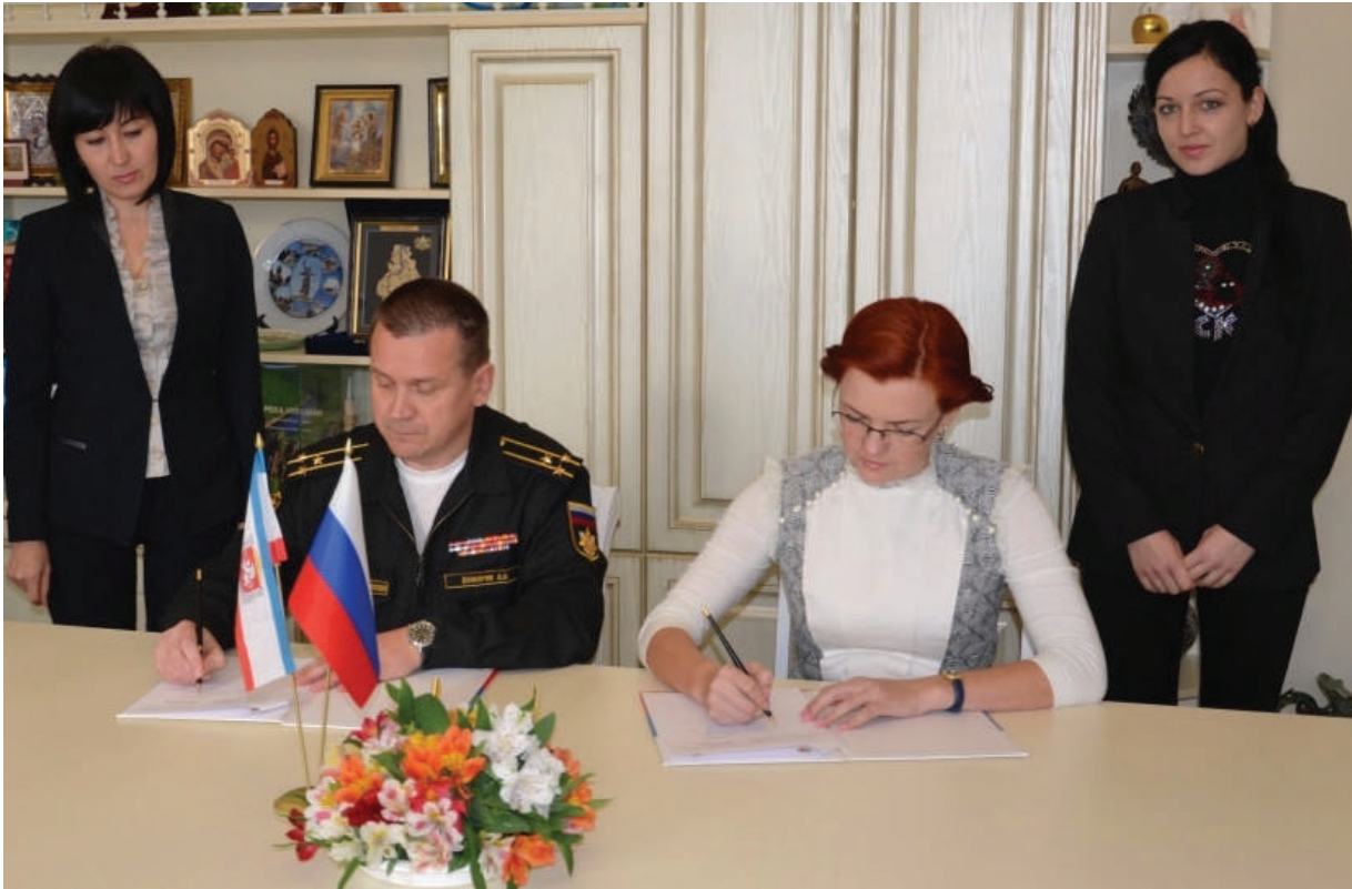
НА СТРАЖЕ РОДИНЫ