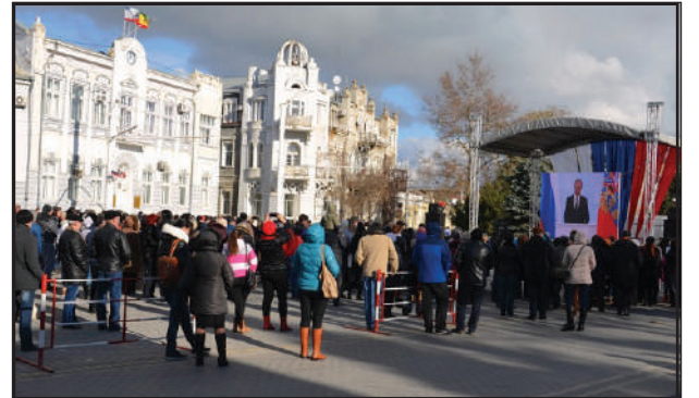
О чем говорил Владимир Путин

Глава администрации города Андрей Филонов