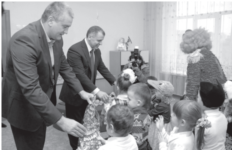
Фото из архива. Сергей Аксенов и Владимир Константинов на открытии детского сада «Чайка» в Заозерном в декабре 2014 года