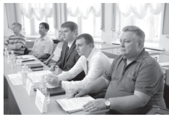
ВЛАСТЬ И БИЗНЕС

Выступают следующие музыкальные коллективы: Семь, Five Chambers, ШнАпS – Band, Deep Spaces.