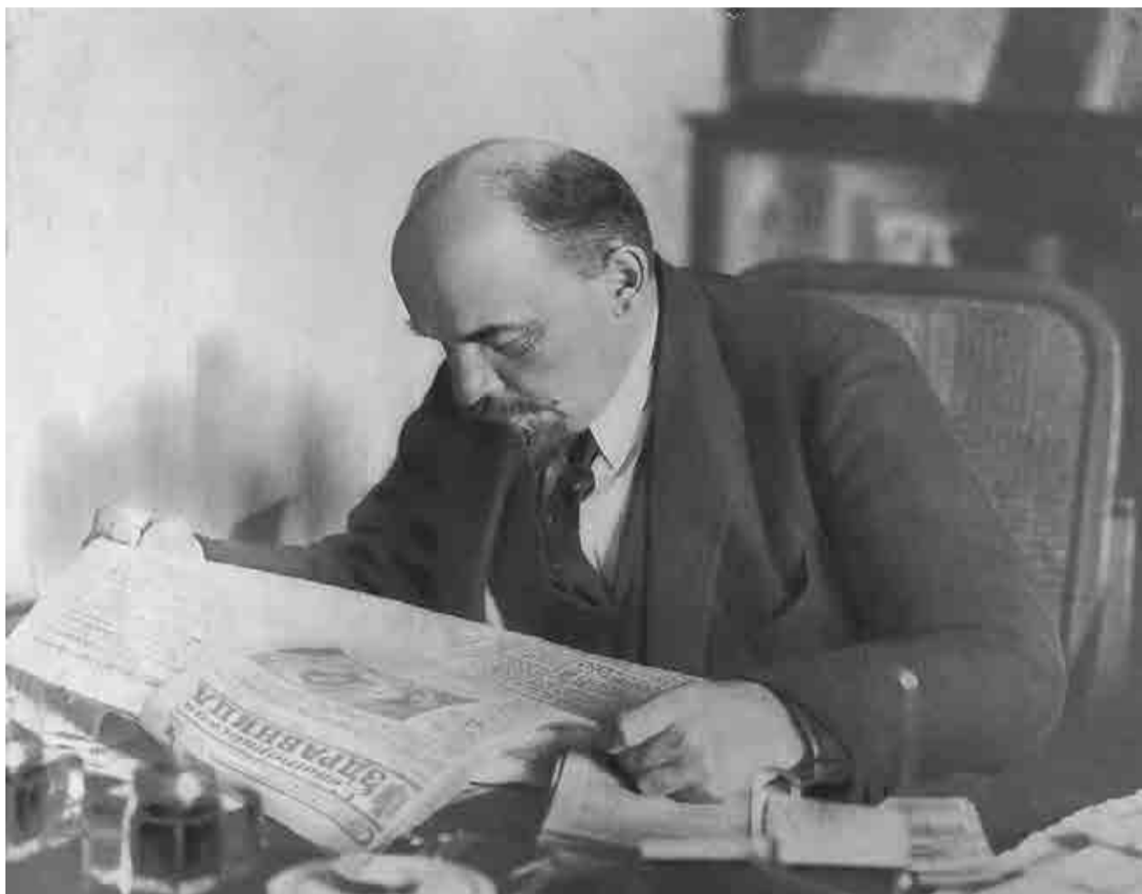
«Газета - не только коллективный пропагандист, но и коллективный организатор» В.И. Ленин

Испытание на прочность. История одной немецкой крымской семьи 16 стр