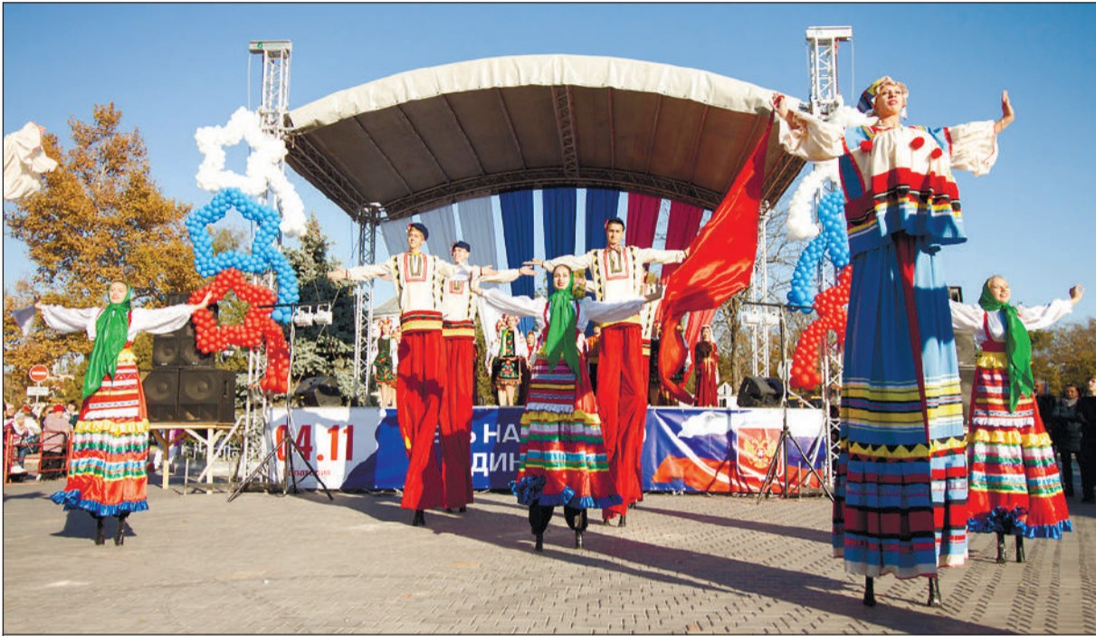
Основные события всенародного праздника развернутся на Театральной площади