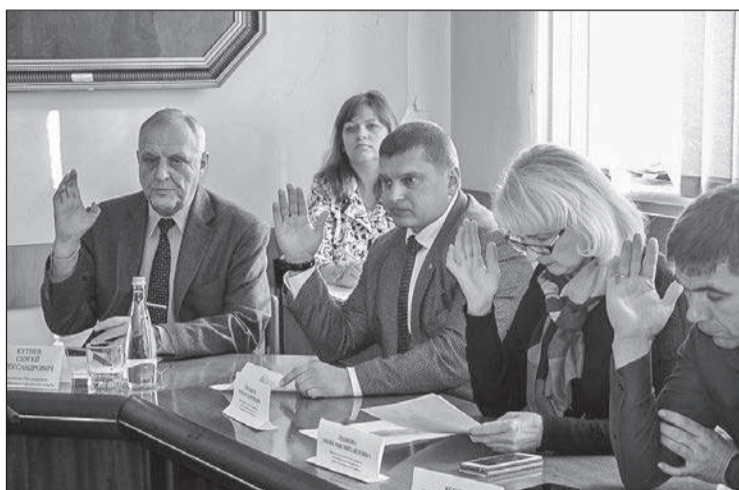
Народные избранники проголосовали за присвоение Дворцу спорта имени Юрия Гагарина

Например, в соответствии с внесенными изменениями выделены средства на реконструкцию дошкольных учебных учреждений в поселке Новоозерное, яслей-сада № 26 «Росинка», детского сада «Золотая рыбка», на проведение ремонтных работ в медицинских кабинетах общеобразовательных организаций, на проведение паспортизации автомобильных дорог общего пользования местного значения, на приобретение специализированной техники и оборудования для санитарной очистки города, на работы по кадастрированию земельных участков под объекты социальной инфраструктуры в микрорайоне Исмаил-Бей. Также выделены средства на реализацию мероприятий государственной программы Российской