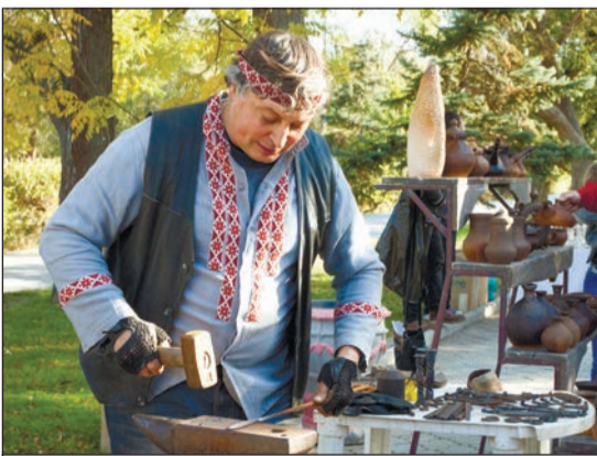
А на улице Дувановской 4 ноября будут работать мастер-классы...

Пресс-служба администрации города.