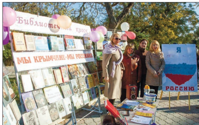
...и откроется библиотечный киоск