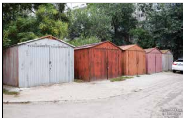
Самовольно установленные гаражи будут демонтированы

ложениями по улучшению инфраструктуры дворов. По результатам весеннего марафона «Чистый двор – уютный город» в этом дворе уже идут работы по установке детского игрового комплекса. Жители также предложили разместить на свободной территории спортивные тренажеры и баскетбольную площадку.