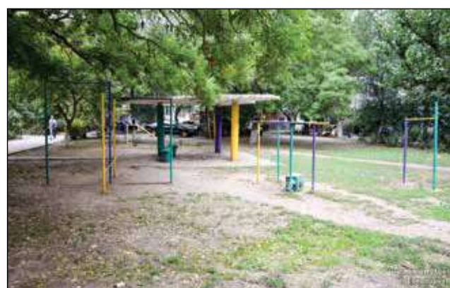
Весной в городе состоится еще один марафон чистоты, по итогам будут выбраны новые дворы для благоустройства

Также жильцы ближайших домов обратили внимание главы администрации на проблему с контейнерной площадкой, возле которой проходит ливневая канализация. Здесь образовалась большая дыра, представ-