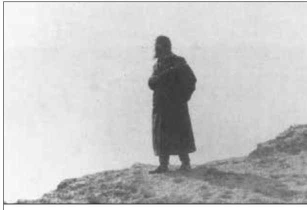
Григорий Распутин на вершине горы Ай-Петри, ноябрь 1911 года

А партия едина В решении своем... Подарок, не подарок, При случае — вернем.