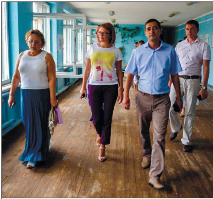
Глава города ознакомилась с ходом капремонта в УВК «Интеграл»

— Всего на капремонт в школах города в этом году выделено почти 148 миллионов рублей. Часть евпаторийских школ должна заметно преобразиться к новому учебному