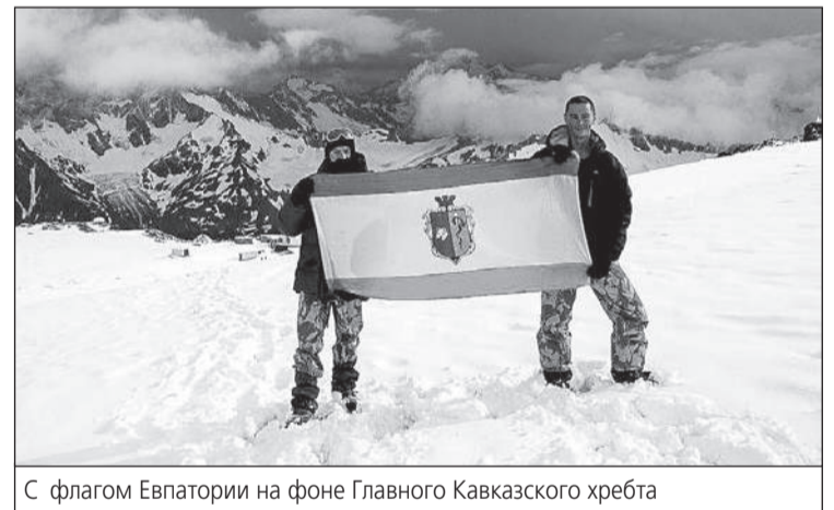
С флагом Евпатории на фоне Главного Кавказского хребта

Беседовал Василий АКУЛОВ.