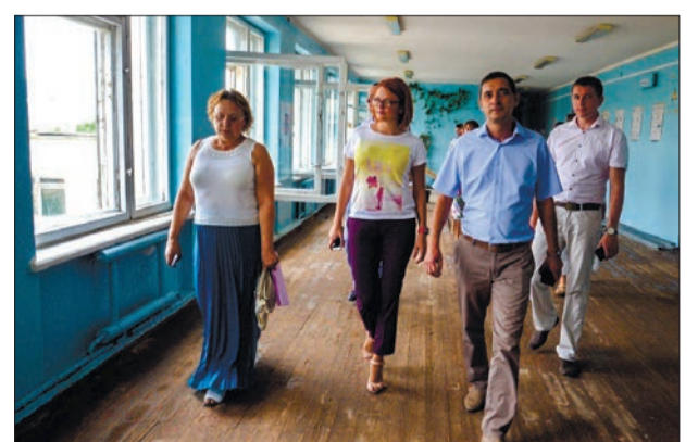
ПРЕОБРАЖЕНИЕ ШКОЛ На капремонт городских школ выделено почти 150 млн рублей