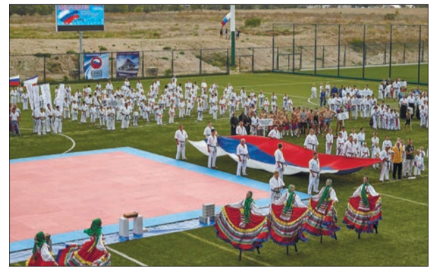
СПОРТ ОБЪЕДИНЯЕТ Фестиваль боевых искусств в Евпатории принял спортсменов со всего Крыма