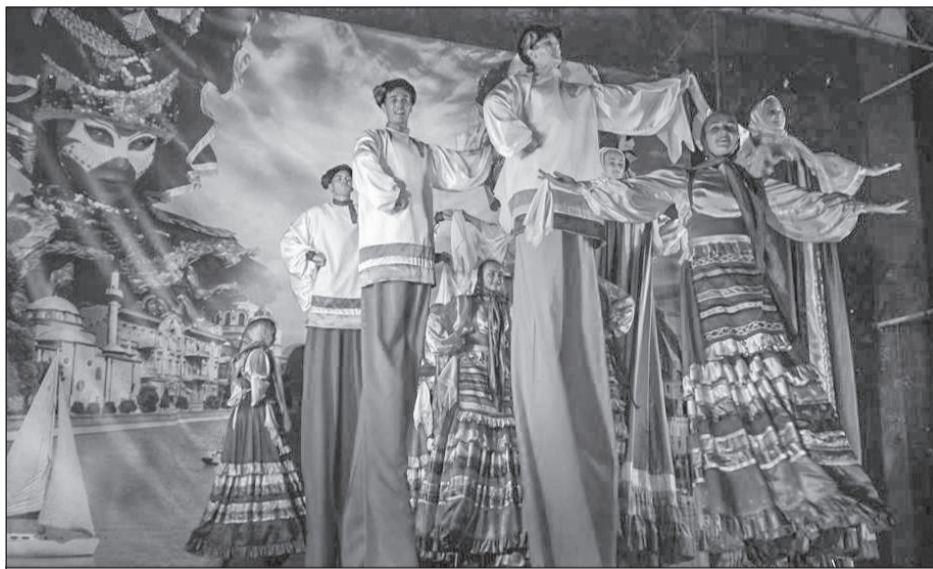
Ходулисты одинаково ярко танцевали народные танцы...

Слава «высокого» театра перешагнула далеко за пределы родного города. Евпаторийских великанов с радостью принимала публика России, Украины, Казахстана, Германии и Испании, Голландии и Великобритании, Фран-