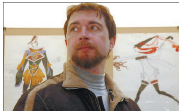
В ШАГЕ ОТ ФИНАЛА Иллюстрация художника Анатолия Прилепского вошла в лонг-лист престижного международного конкурса