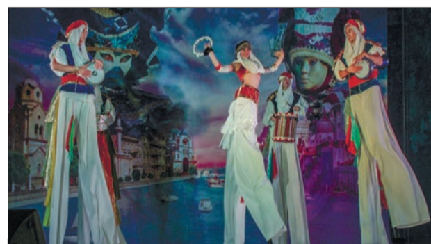
ВЕЛИКАНСКИЙ ЮБИЛЕЙ Театр на ходулях отметил свое 15-летие большой шоу-программой с «отточенными до совершенства» номерами