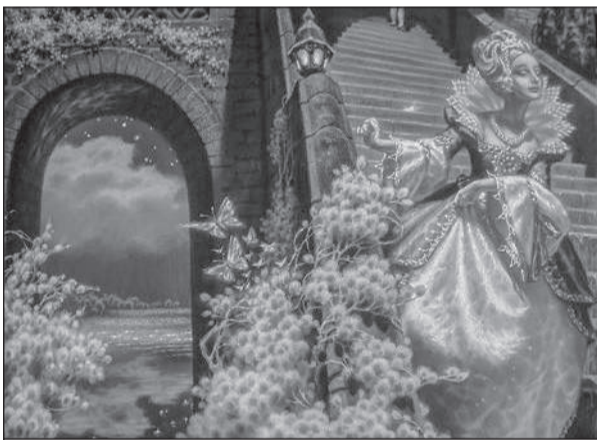
Иллюстрация к сказке «Золушка», представленная на конкурс

Игорь ЛИТВИНЕНКО.