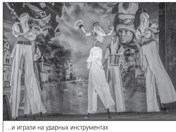
...и играли на ударных инструментах