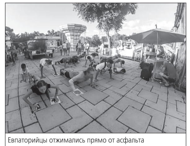
Евпаторийцы отжимались прямо от асфальта

Физкультурный флешмоб с таким незатейливым названием прошел в минувшие пятницу и субботу, в 18.00 по московскому времени, в ста городах России от Севастополя до Владивостока, в том числе и в Евпатории. По замыслу организаторов акции, два дня подряд в одно и то же время участники действия, в общей сложности около 100 тысяч человек, совершали отжимания от земли. Флешмоб приурочили к Дню семьи, любви и верности.