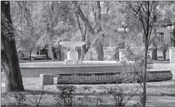
Сквер имени Гоголя

В Евпатории на пересечении улиц Гоголя и Кирова весной 2017 года планируют открыть Сквер литераторов.