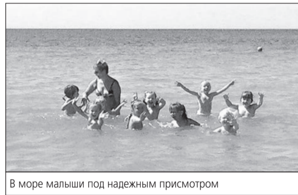
В море малыши под надежным присмотром

Людмила ПУШКИНА.