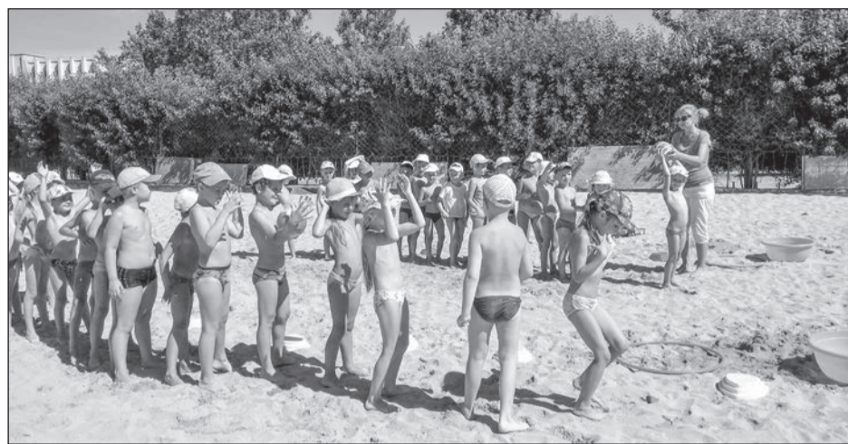
«Веселые старты» на морском берегу

Евпатория – единственный город в Крыму, где детсадовцев организованно вывозят на пляжи. Малыши не только купаются в море, но также принимают солнечные ванны, делают физическую зарядку и играют в активные игры.