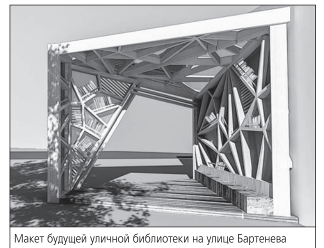
Макет будущей уличной библиотеки на улице Бартенева

Василий АКУЛОВ. Фото автора, визуализация Виталины ДЕРКАЧ.