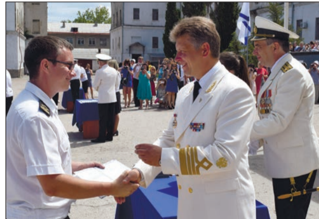
Министр транспорта вручает дипломы выпускникам

— Мы непрерывно оснащаем этот филиал новейшим оборудованием — и тренажерным, и лабораторным, и учебным. Только в этом году Российская Федерация потратит около 90 миллионов рублей до конца года на оснащение реальных судовым оборудованием, самой современной спутниковой