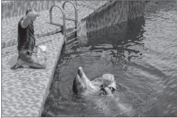
Дельфинотерапия — великолепная психологическая реабилитация, помогающая и взрослым, и детям

Лето в самом разгаре: теплое море, солнечная погода, горячий песок. Именно в это время больше всего хочется куда-нибудь поехать отдохнуть и расслабиться, а все заботы оставить в душном офисе. Такую возможность получили победители нашей акции «Билет за ответ», которые выиграли приглашение на базу отдыха «Степная гавань». Наш корреспондент отправился туда вместе со счастливицами.