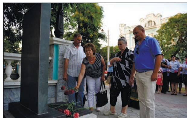
МЫ ПОМНИМ Всероссийскому Дню памяти и скорби город посвятил множество мероприятий

дежная инициативная группа» совместно с проектом «Gefestshow», при поддержке отдела по делам семьи и молодежи администрации города и общероссийского общественного движения «Социал-демократический союз молодежи «Справедливая сила».