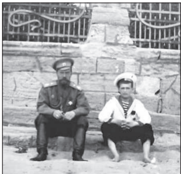
Император Николай II с цесаревичем Алексеем у забора дачи