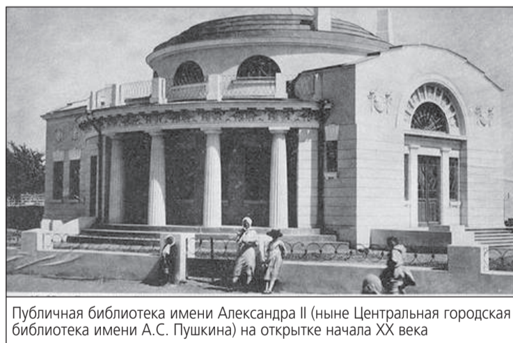
Публичная библиотека имени Александра II (ныне Центральная городская библиотека имени А.С. Пушкина) на открытке начала XX века

В мае 1914-го (на несколько месяцев раньше, чем в губернском центре) на территории Евпатории открыли трамвайное движение. Причем первый (с точки зрения