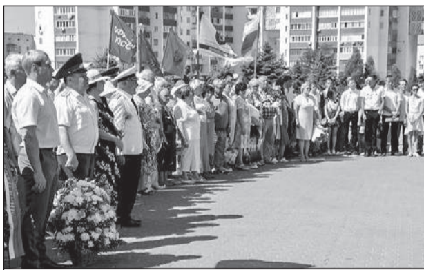
Горожане пришли на «Красную горку» почтить память погибших в Великой Отечественной войне