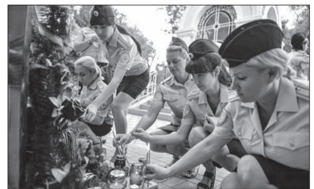
В своих молитвах полицейские вспоминали сотрудников правоохранительных органов, отдавших жизнь за Победу

Представители различных молодежных объе-