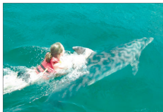
ВАЛЬС С ДЕЛЬФИНОМ Корреспондент «ЕЗ» побывал на базе отдыха «Степная гавань» вместе с победителями акции «Билет за ответ»