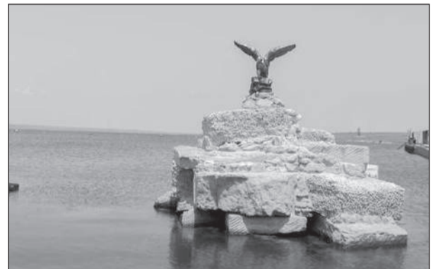
Вот такой симпатичной композицией встречает своих посетителей база отдыха «Степная гавань»