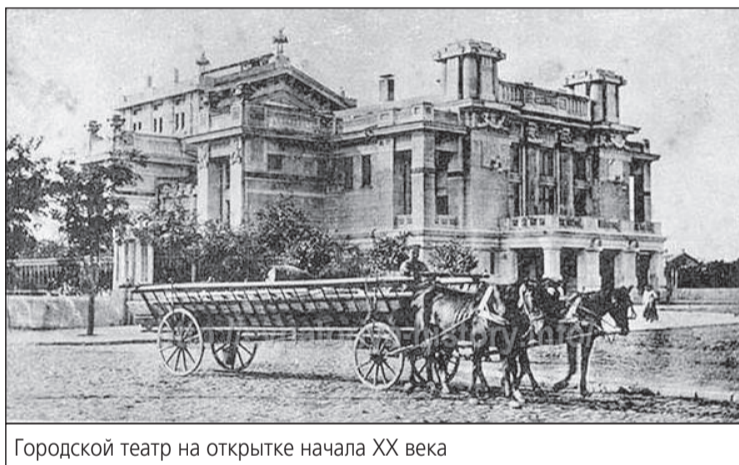
Городской театр на открытке начала XX века

В 1899 году, всего через год после начала общественной деятельности, 29-летний Семен Дуван добился в столичном Санкт-Петербурге выделения городу 250 тысяч рублей. На эти деньги удалось замостить две трети городских улиц. В полной мере организаторские способности Дувана раскрылись после избрания его городским головой в 1906 году. Лишь в начале 70-х годов XX столетия Евпатория вышла за пределы той планировочной схемы, которая была заложена Дуваном в начале века. Что же предложил Дуван? Он предложил развивать город в западном направлении, между Карантинным мысом и Мойнакским озером. Путь на восток преграждал участок казенной земли, чуть более двух тысяч десятин. Для воплощения своего замысла Дуван, минуя бюрократические формальности, использовал личные связи с влиятельными членами Государственного совета, благодаря чему 12 апреля 1907 года организовал покупку земли в коммунальную собственность за чисто символическую цену 9,6 тысячи рублей с рассрочкой платежа на 20 лет. На