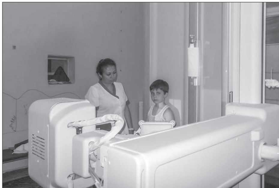
Многофункциональный итальянский R-аппарат, позволяющий проводить R-графию, R-скопию, томографию, контрастные исследования в цифровом виде