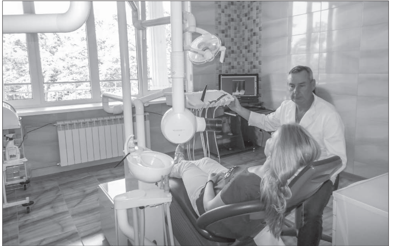
Новое стоматологическое отделение, где оказывают терапевтическую и хирургическую стоматологическую помощь с использованием визиографа