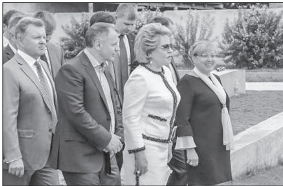
Впервые участие в фестивале приняла председатель Совета Федерации Валентина Матвиенко (на переднем плане вторая справа)