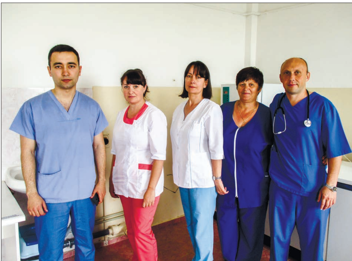
Одна из бригад реанимационного отделения городской больницы