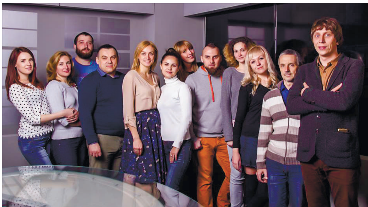
Коллектив «Евпатории ТВ» планирует как минимум раз в месяц выпускать в свет новый проект