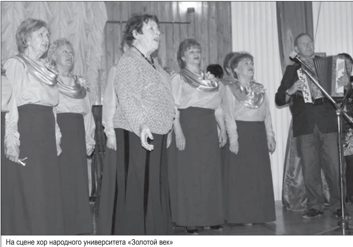
На сцене хор народного университета «Золотой век»

В двух евпаторийских необычных вузах, где обучаются пенсионеры, прошли выпускные балы. В концертном зале санатория «Орен-Крым» 17 и 18 мая убеленные сединами выпускники «Университета третьего возраста» и народного университета «Золотой век» соответственно получили дипломы и заслуженные награды.