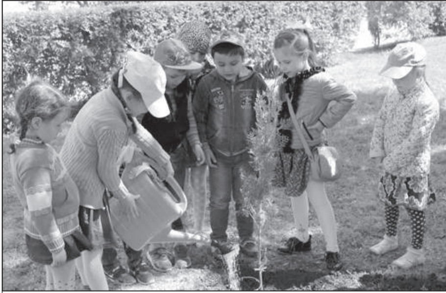
Только что юные озеленители посадили еще один куст туи

– В рамках этого образовательного мероприятия детишки дошкольного возраста, благодаря