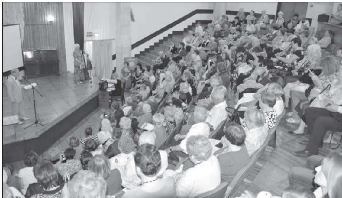
Выпускной вечер в «Университете третьего возраста»