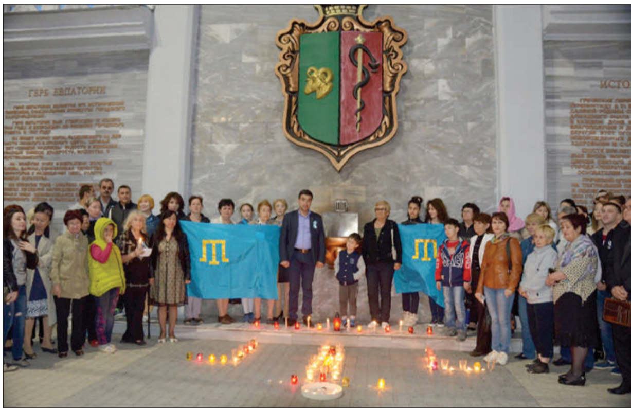
На Театральной площади выложили из свечей тамгу – национальный символ крымских татар