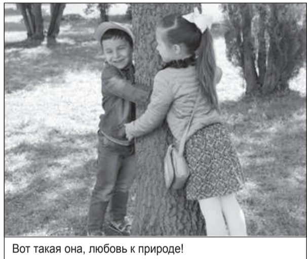
Вот такая она, любовь к природе!