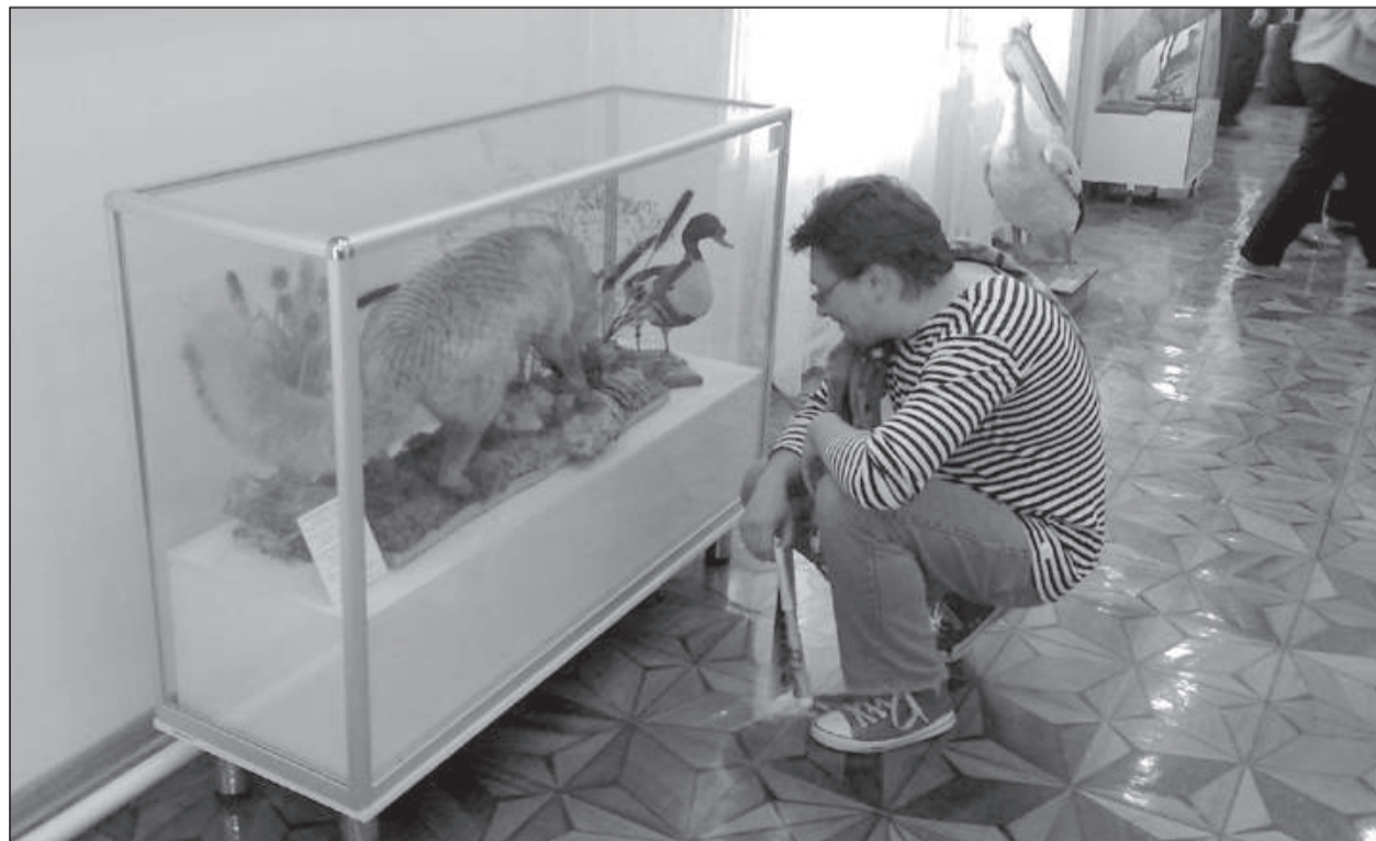
Чучело лисы обыкновенной в зале «Природа края»

В 2005 году французы выдвинули идею о ежегодном проведении Международной музейно-выставочной, культурно-образовательной акции «Ночь музеев», тогда же эту идею утвердил Совет Европы. Аксию, которая проводится под патронажем Совета Европы, поддерживает Международный совет музеев (ICOM). Главной ее целью является возможность привлечь и заинтересовать посетителей яркими, нестандартными программами, посвященными культурному и историческому наследию. Открытость для зрителей – основной девиз «музейной ночи» во всем мире.