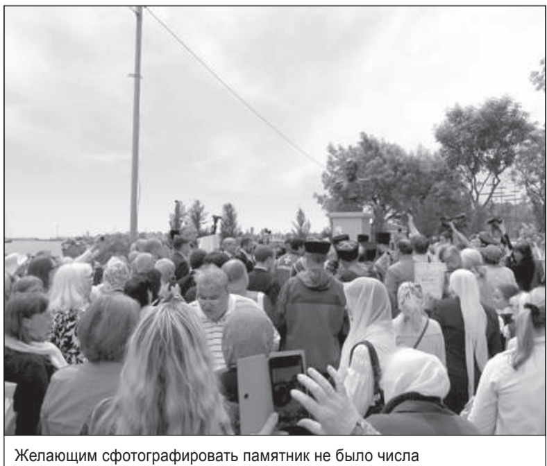
Желающим сфотографировать памятник не было числа

Кроме того, Степашин выразил надежду, что 2017-й станет для России «годом «безнефтяного»