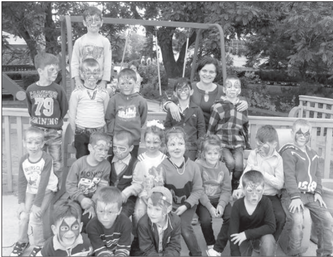
Профессиональное кредо молодого педагога – понять, принять и полюбить каждого малыша

– Работая в детском саду, я поняла, что человек, работающий с детьми, должен быть универсалом, креативной, постоянно