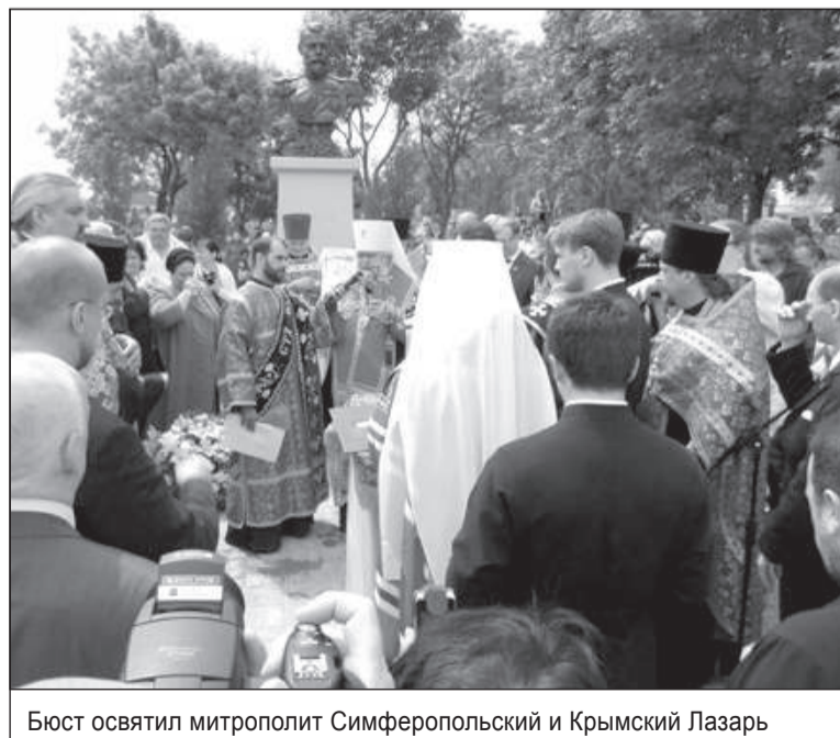
Бюст освятил митрополит Симферопольский и Крымский Лазарь