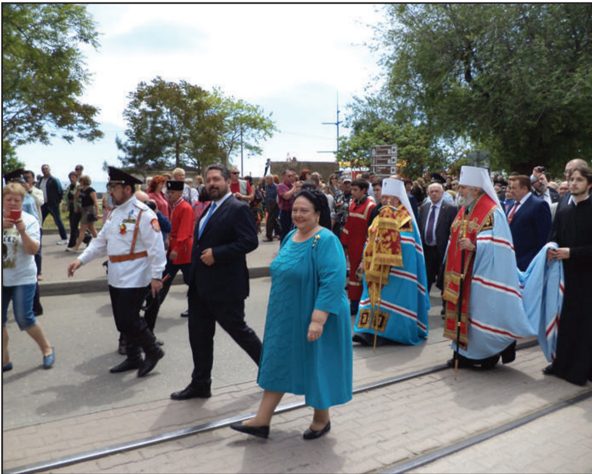
Великая княгиня Мария Владимировна с сыном Георгием Михайловичем прогулялась по улице Революции