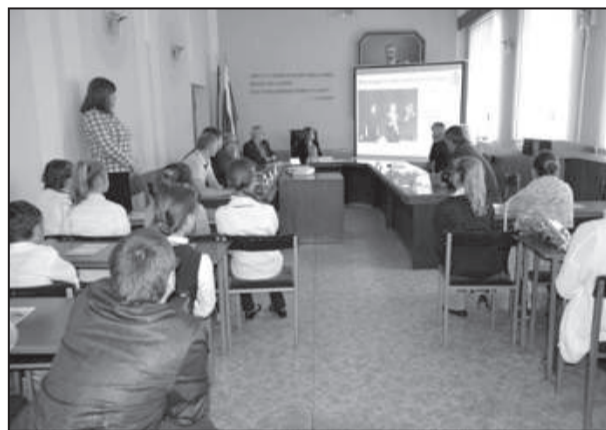
Ребята с интересом узнали о том, как работают органы местного самоуправления