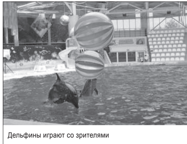
Дельфины играют со зрителями