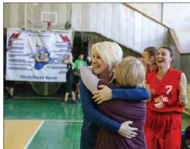
ЯРКИЙ ПРИМЕР УСПЕХА Юные баскетболистки из Евпатории блестяще выступили на престижных соревнованиях

Шасне СУЛЕЙМАНОВА.