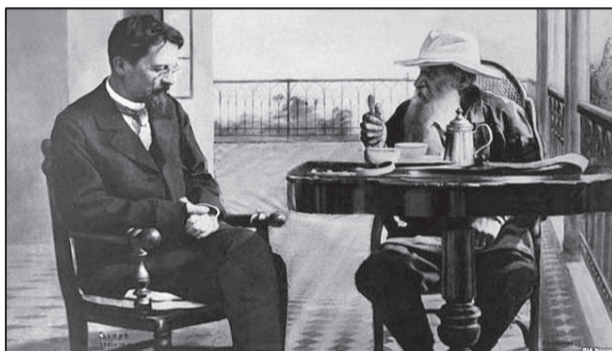
Антон Павлович Чехов и Лев Николаевич Толстой в Гаспре, 1901 год