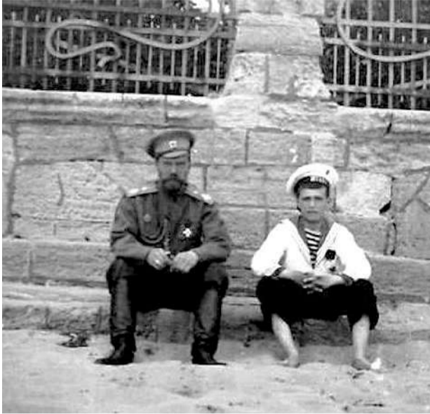
С сыном у дачи Дувана

преданности», – сказал в приветственном слове С.М. Шапшал. Особо он отметил, что караимы, несмотря на малочисленность их народа, отобрали на поле брани Первой мировой войны одну пятую часть всех своих мужчин.