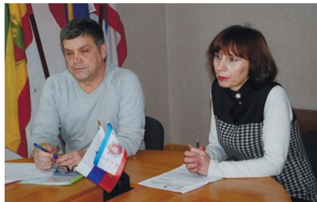
Поделились секретами бизнес-успеха