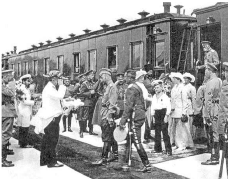
Встреча царской семьи на вокзале