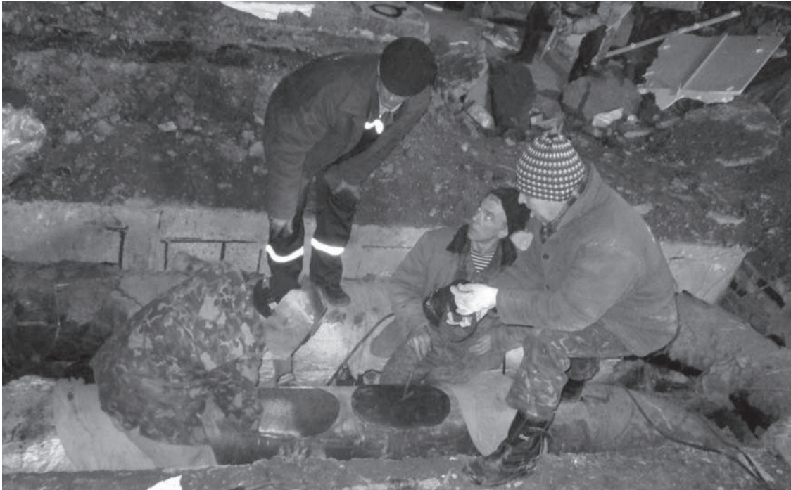
Та самая теплотрасса, прорыв которой стал первопричиной сноса торговых объектов с «Олимпа»