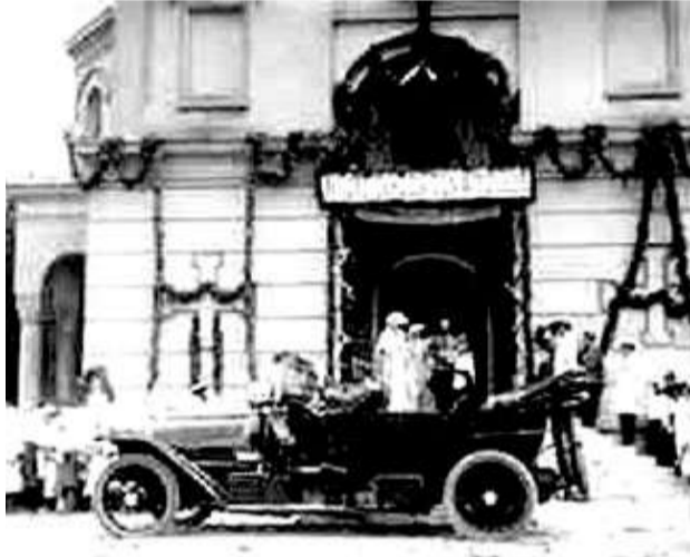
У Свято-Николаевского собора

Прошел век, и этот царский путь по старому городу был возрожден краеведами, экскурсоводами, городскими властями и стал общеизвестным туристическим маршрутом «Малый Иерусалим». Но