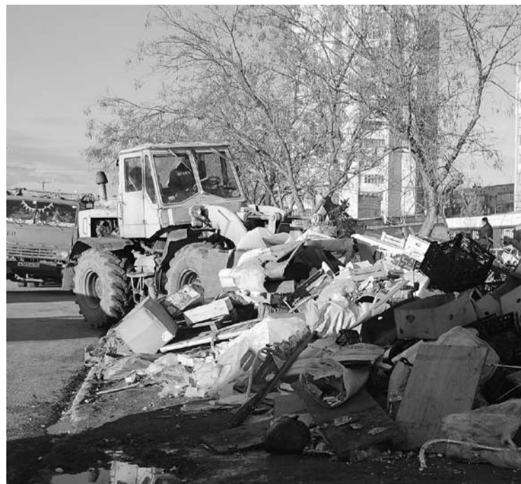
Коммунальные службы сработали оперативно