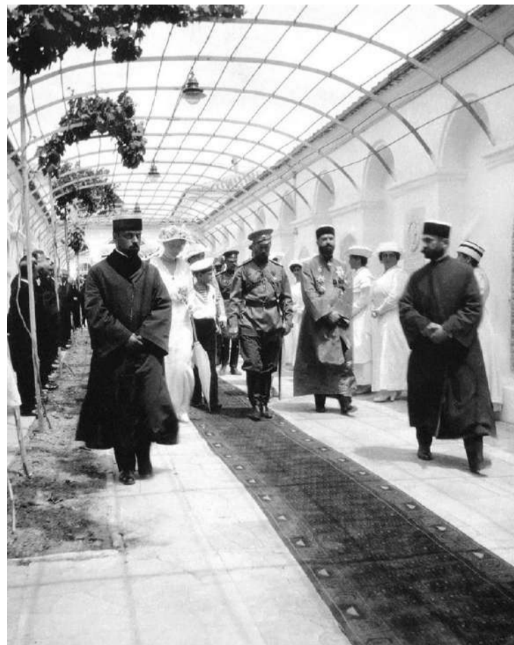
Посещение Большой кенасы

Из православного собора путь лежал далее через Соборную площадь в мечеть Хан-Джами, где императорскую семью приветствовал глава