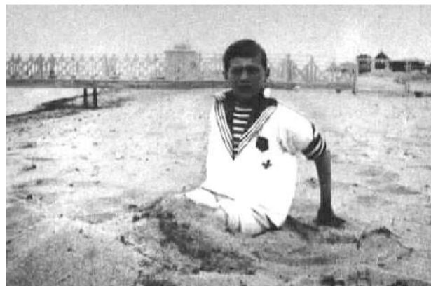
Цесаревич Алексей на пляже

Перед отъездом из лазарета императрица Александра Федоровна лично изволила сделать фотографические снимки