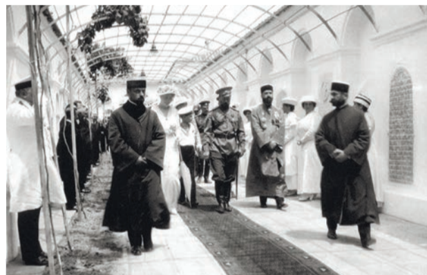
Один день из жизни императорской семьи