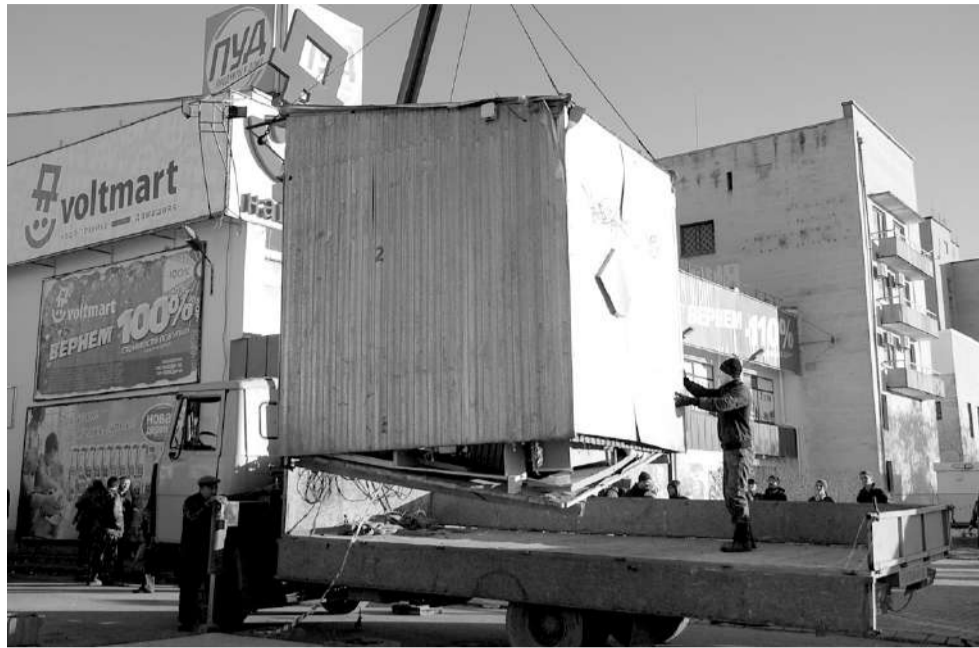
9 февраля на территории продовольственного рынка «Олимп» (на пересечении пр.Победы и ул. 9 Мая) демонтировали последний торговый павильон

О сносе рынка «Олимп» в Евпатории не говорят разве что младенцы. И хотя демонтаж незаконных объектов практически завершен, всевозможные слухи вокруг этой ситуации продолжают ежедневно множиться, смешиваются и превращаются в масштабную путаницу. «ЕЗ», обратившись к конкретным фактам, документам и комментариям компетентных лиц, разобралась в основных «олимпийских» правдах и неправдах.