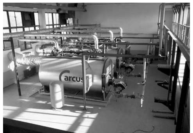
Так выглядит котельная изнутри сегодня.