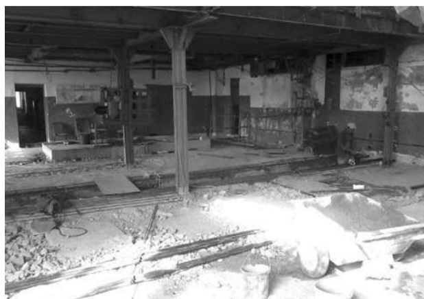
На заре ремонтных работ