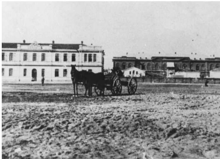
Мужская и женская гимназии. Вид со стороны моря

Интервью записал Павел СЕРЕДА, учащийся 10-А класса гимназии имени Сельвинского