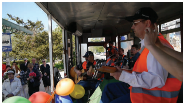
В Евпатории 70-й День Победы отметили с музыкальным трамваем

По словам музыканта, «Приморский бульвар» играет винтажную музыку 30–60-х годов прошлого столетия – свинг, фокстроты, вальсы, самбу и латино.