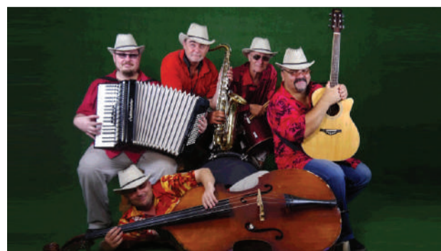
«Приморский бульвар» в трамвайном депо