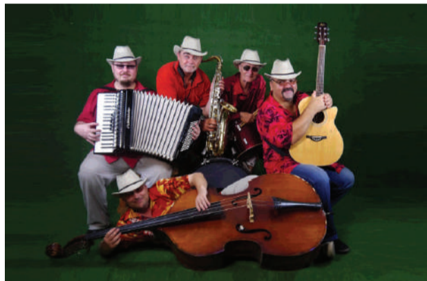
Называя себя винтаж-группой, музыканты намекают и на ретро-репертуар

хо настроенную). А когда-то здесь звучала настоящая музыка, играл духовой оркестр, оживляя все вокруг. Музыка, от которой, по словам поэта Леонида Дербенева, «так хочется жить».