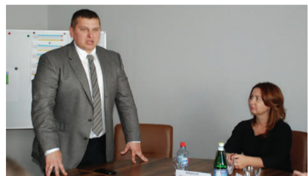
«Сталкер» идет в ногу со временем