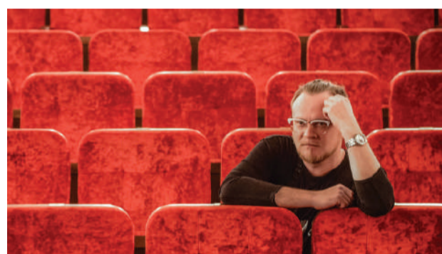
Один год из жизни «нетипичного режиссера»

Плановые заседания комиссии планируется проводить один раз в квартал.