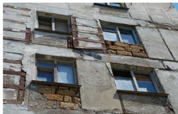
Общежития на Крупской отремонтируют