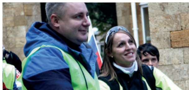
Веловыходные в Евпатории