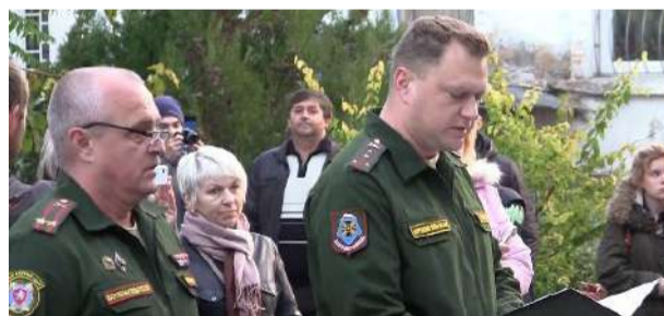
Продолжается осенняя призывная кампания