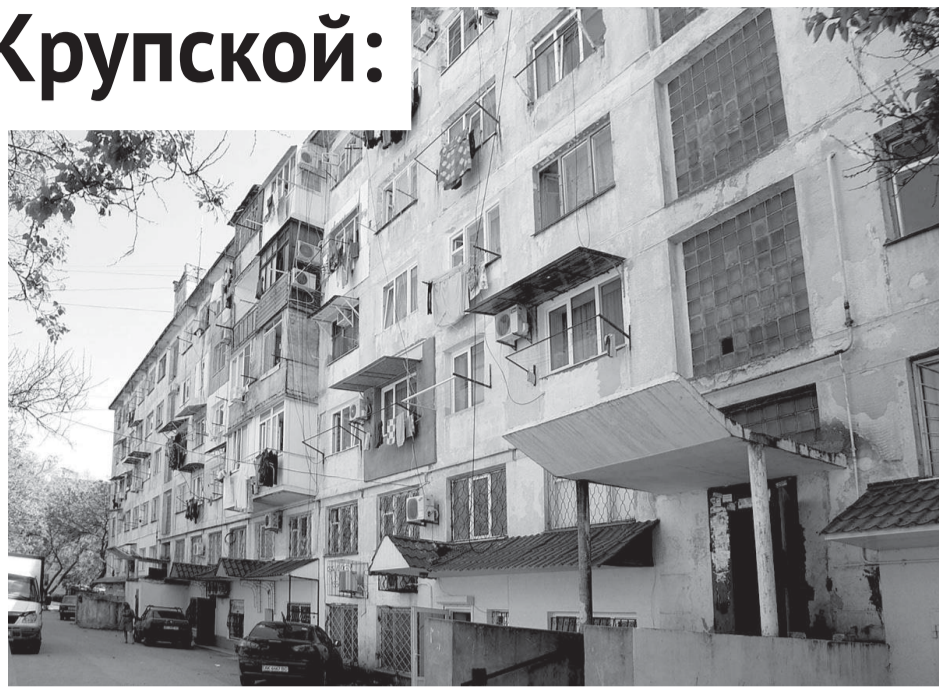
Жители многострадальных общежитий по улице Крупской в Евпатории давно ждали решения их жилищных проблем

Во время встречи горожане буквально засыпали представителей власти вопросами. Самый волнующий из них – не лишатся ли дома статуса аварийного жилья после ремонта кровли и отопления. Депутаты успокоили евпаторийцев,