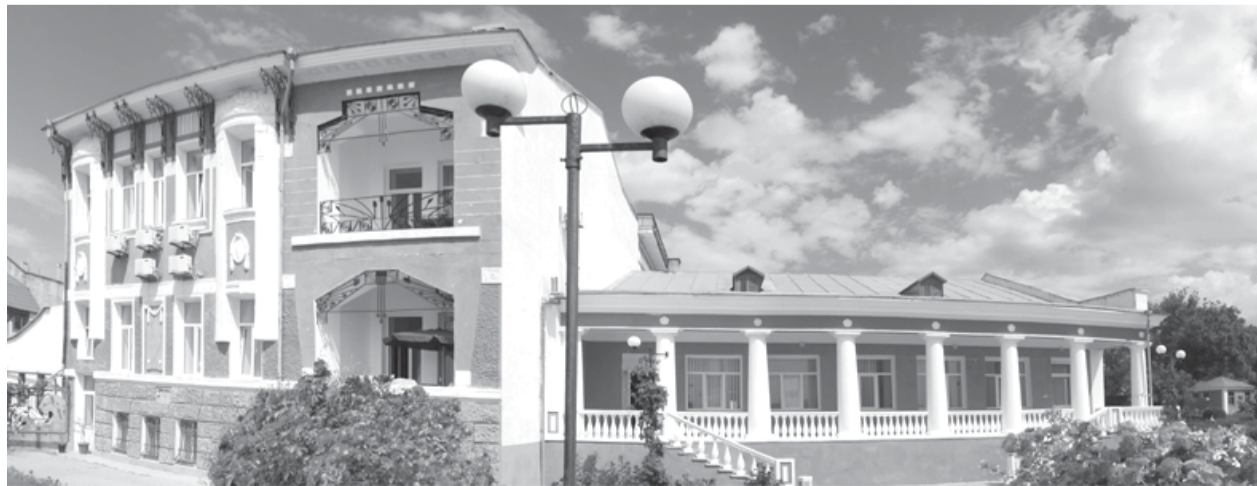
Евпаторийский пансионат «Трехгорка»