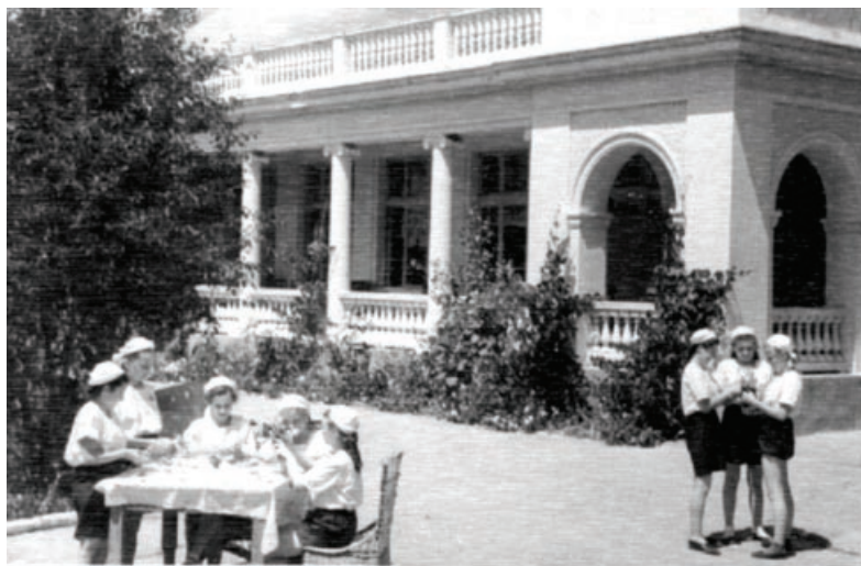
Отдых в Евпатории 70 лет назад

В этом году санаторий «Смена» отмечает свою очередную годовщину — исполняется 83 года его службе здоровью человека. По случаю этой даты, а также в честь 70-летия Великой Победы в здравнице силами сотрудников высажен сквер Славы. Молодые крымские сосны еще больше украсят территорию санатория, напитают живительным ароматом окружающий его чистый воздух, усилят царящую здесь атмосферу покоя и блаженства, тишины, нарушаемой лишь гомоном птичьих стай.