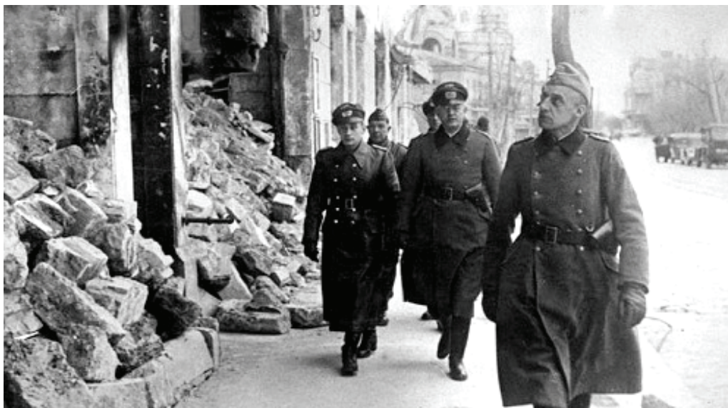
Оккупанты на улицах Евпатории

Ознакомиться с фотовыставкой можно в МБУ «Архив города Евпатории» во вторник и четверг с 8 до 17 часов по адресу: ул. Демьшева, 100а.